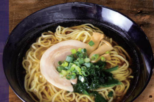
しょうゆラーメン