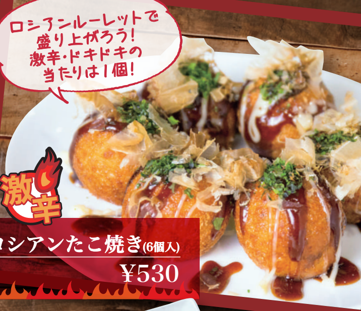
ロシアンたこ焼き(6個入) ¥530