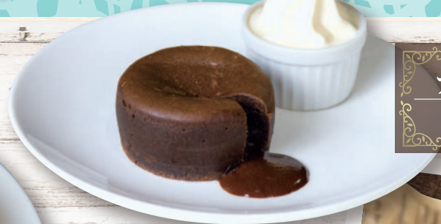
フォンダンショコラ ¥500