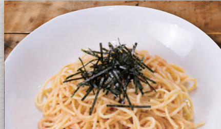
和風たらこパスタ ¥600