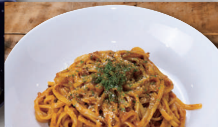
クリーミーボロネーゼ ¥630