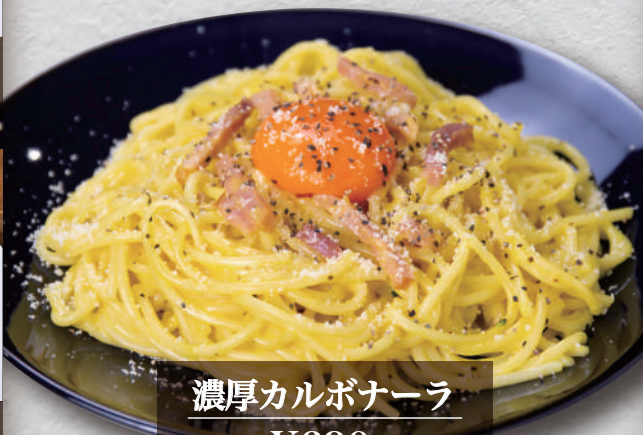
濃厚カルボナーラ ¥630