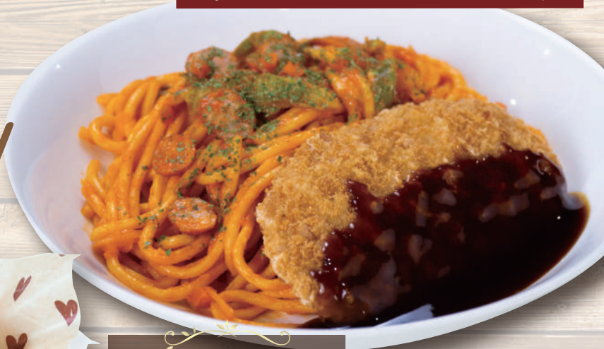
スパかつスペシャル ¥880