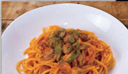
喫茶店のナポリタン ¥600