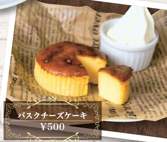
バスクチーズケーキ ¥500