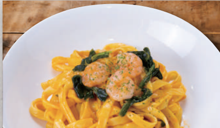
海老のトマトクリーム ¥630